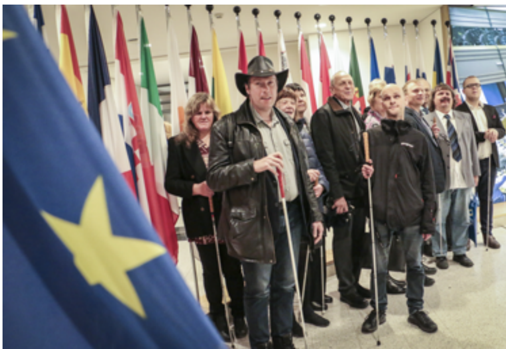
Under en studieresa till Bryssel i november deltog totalt 24 personer inklusive ledsagare. Gruppen genomförde studiebesök hos European Disability Forum, EU-kommissionen, den svenska representationen samt i EU-parlamentet.