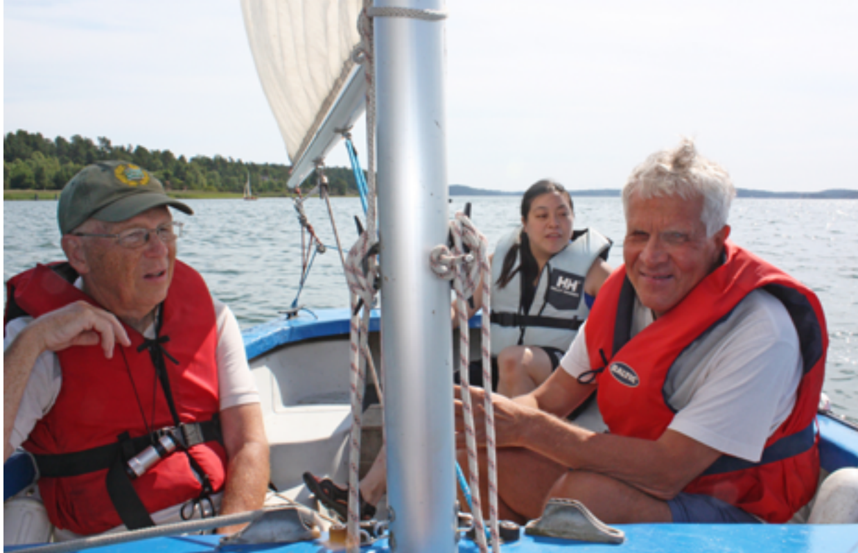
I juli ordnade Sällskapet Seglare med Synnedsättning ett läger på Almåsa konferens för seglingsugna.