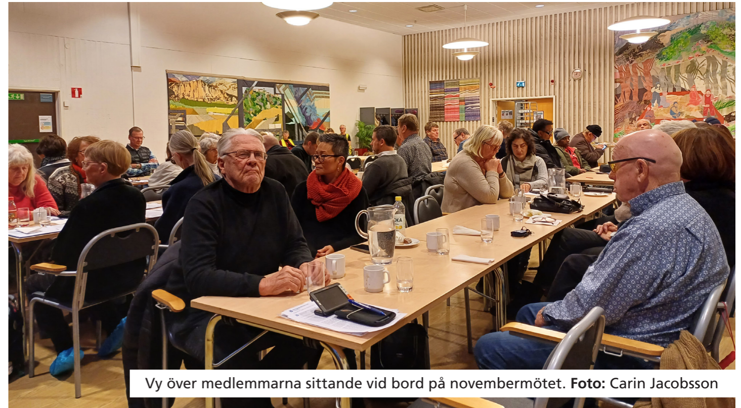
Vy över medlemmarna sittande vid bord på novembermötet.

När vi fått upp energinivån tog vi oss an kvällens andra punkt där vi i grupper diskuterade föreningens ledsagning samt vad det innebär att vara aktivitetsledare. Gruppdiskussionerna togs sedan i helgrupp där flertalet kärnfulla synpunkter lyftes, så som att aktivitetsledaren för en aktivitet kan få arbeta tillsammans med en ledsagare i planering och genomförande. Synpunkter som vidare tagits med i kansliets och styrelsens planering av verksamheten 2024. Många av oss tyckte att diskussionerna i grupperna var givande och vi hoppas detta sätt att ta oss an föreningsfrågor kan bli ett återkommande inslag på framtida möten.