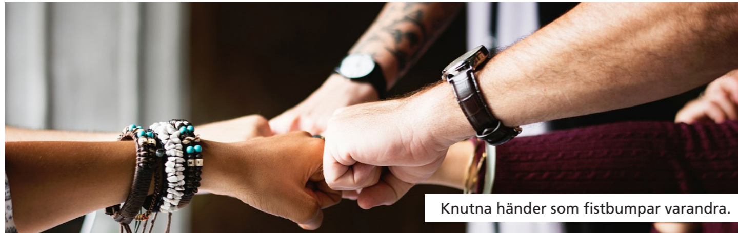
Knutna händer som fistbumpar varandra.