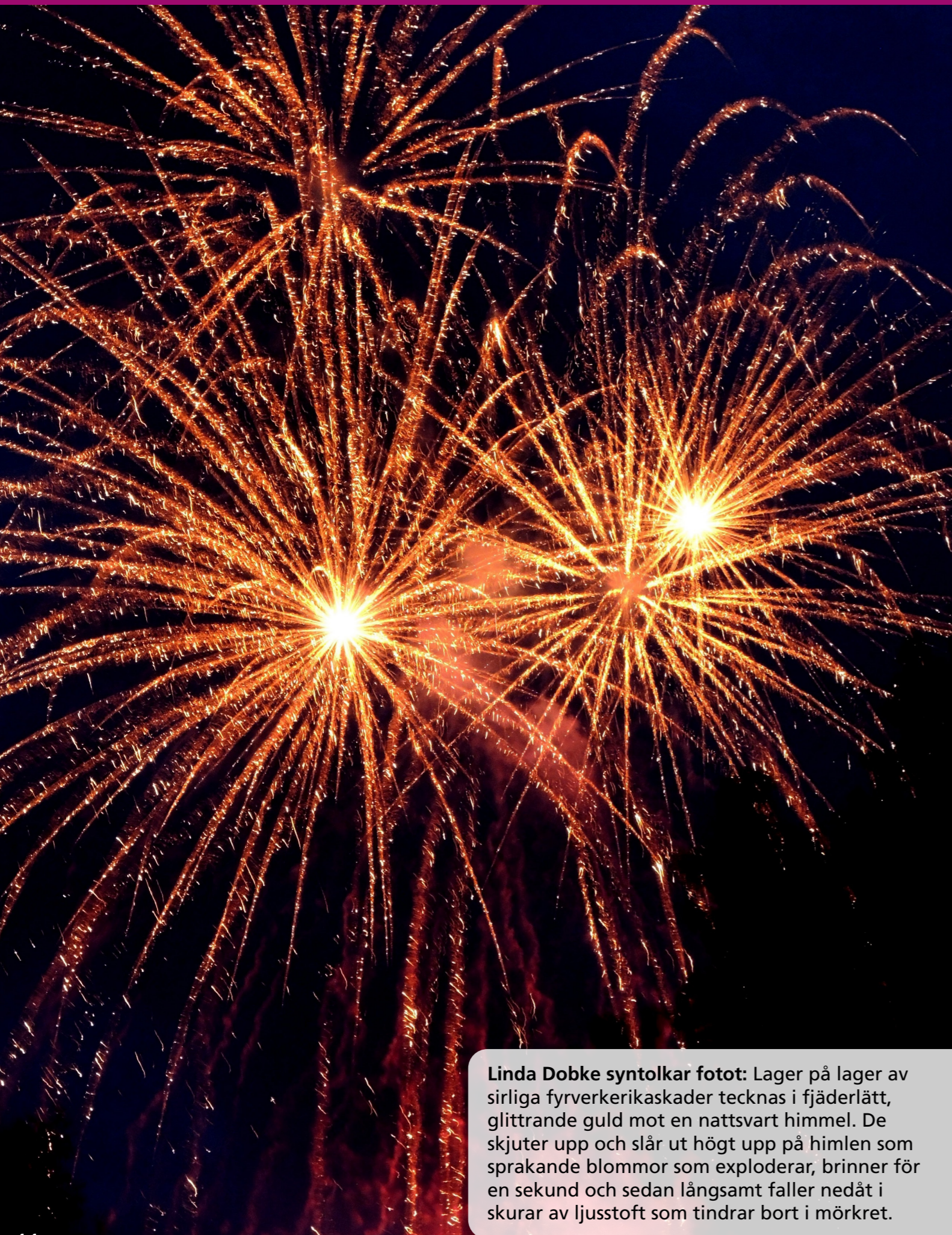
Linda Dobke syntolkar fotot: Lager på lager av sirliga fyrverkerikaskader tecknas i fjäderlätt, glittrande guld mot en nattsvart himmel. De skjuter upp och slår ut högt upp på himlen som sprakande blommor som exploderar, brinner för en sekund och sedan långsamt faller nedåt i skurar av ljusstoff som tindrar bort i mörkret.