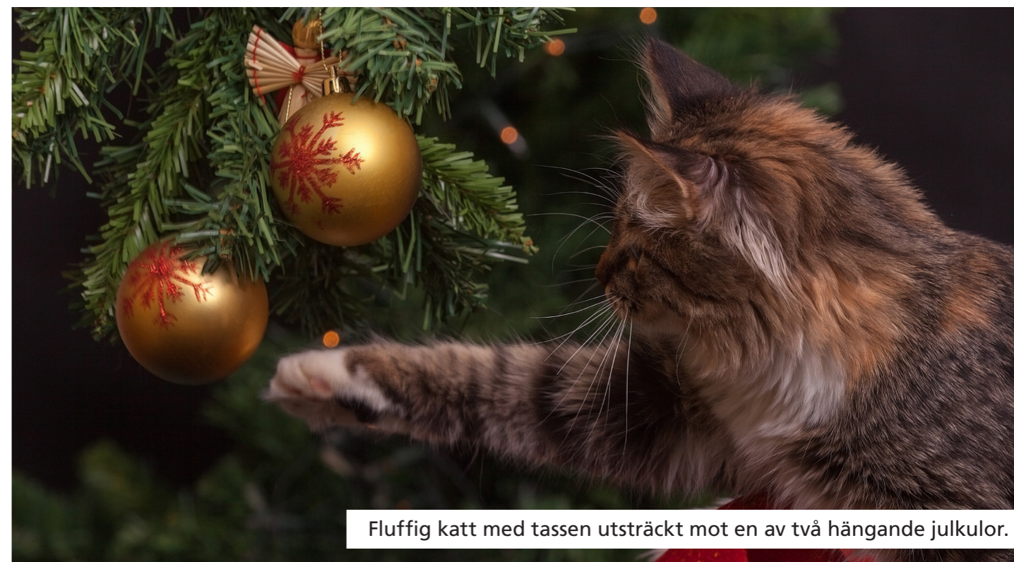
Fluffig katt med tassens utsträckt mot en av två hängande julkulor.