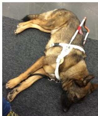
Bild på Camilla från Bohuslän och hennes ledarhund Messi, som på bild nr 2 tar sig en liten paus.