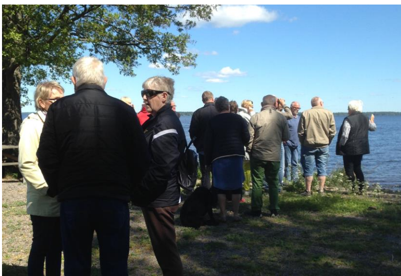
Bild: Vid Stenörsviken på Vinön.

Hjälmaren är Sveriges fjärde största sjö. Sedan tog vi bussen till norra sidan av ön, Stenörsviken med