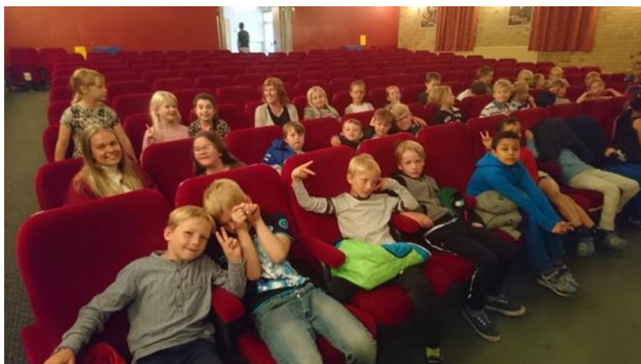
Bild: På bion träffade vi förväntansfull barnaskaran.

Efter filmen gjordes också ett besök i den nya och omdiskuterade Badhusparken i Vara som blev invigd någon dag tidigare.