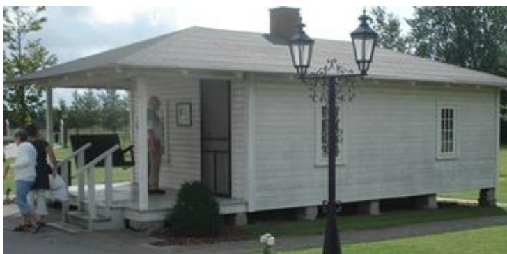
Bild på Presleys första hem och en staty av Elvis.