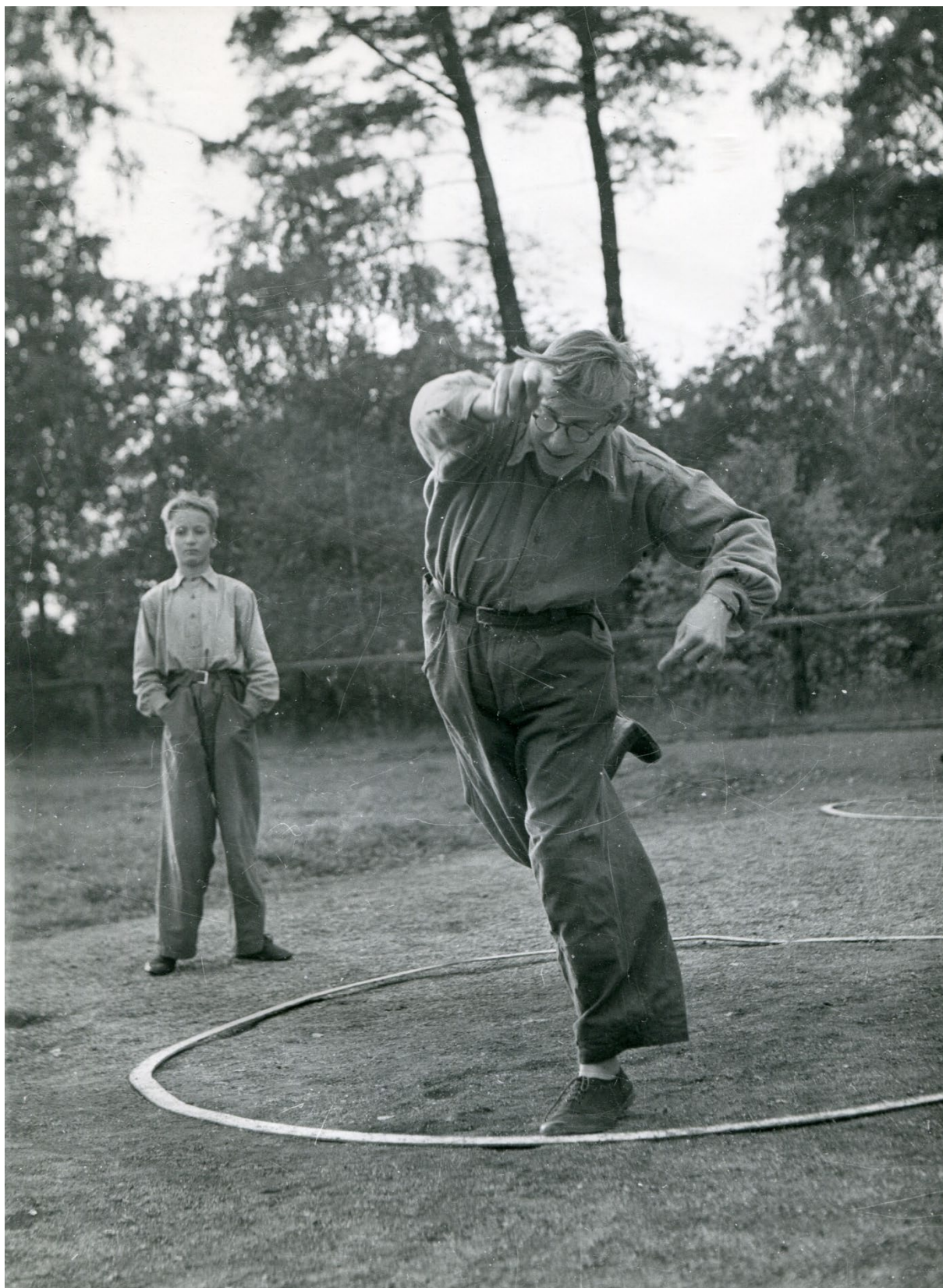
Bild på kulstötande pojke vid Skolmästerskap i idrott 1949 på Tomtebodå.