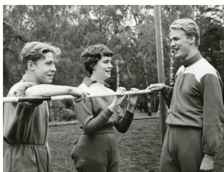
Bild på tre glada elever som kollar av höjden på hoppställningen innan hopp vid skolmästerskap på Tomtebodas 1960.

sådan gymnastik som jag antar att andra också gjorde. Vi skulle ligga på golvet och skutta upp, utan att direkt anstränga oss, rätt så snabbt. Det kommer jag särskilt ihåg för det tyckte jag var rätt så svårt. Annars så körde vi hoppa-steg runt om i ring. Man lyssnade var dom andra var, på något sätt. Alla var ju synskadade där och vi körde nog ett vanligt program inomhus. Så var vi ju utomhus också. Vi hade en idrottplats där på skolan, där det fanns löparbana, höjdhopp och längdhopp. Så fanns det en skridskobana också. Så hade vi ju gungor och klätterställningar och sånt där, så vi var ute mycket och lekte och hängde i knävecken och klängde i det där. Så det var mycket rörelse, i alla fall för min del. Och ibland så gick vi till idrottsplatsen och lekte och hoppade lite höjd på fritiden. Jag kommer särskilt ihåg att jag kom dit en gång och så var det några klasskompisar där. När dom hängde upp ribban så satte dom den så att dom här piggarna för ribban med kedjan satt runt ribban. Då sa jag att så där ska det inte vara. Och jag tror att det måste ha varit i någon av de första årsklasserna i alla fall. Sen hoppade vi långrep också, det kanske kom lite högre upp men vi hoppade rep i alla fall. Jag tror att många av oss rörde oss rätt normalt som andra barn också gör, medan en del gick ut genom porten och stod där utanför eller gick med någon personal en liten sväng och rörde sig. För alla vågade inte röra sig så mycket.” 12