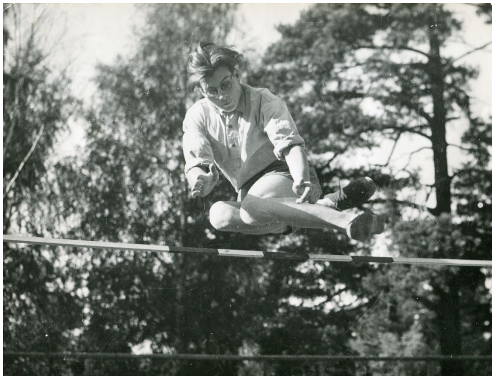
Bild på yngling mitt i höjdhoppet över ribban. Tomteboda 1947