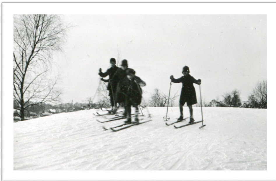
Bild på elever med skidor i backen vid förskolan på Tomtebodas 1920-tal.

var besatta på utförsåkning på berget vid institutets östra gavel. Där fanns möjlighet att välja olika nivåer allt efter djärvhet och uppnådd skicklighet. Göte berättar vidare hur de en senhöst plötsligt upptäckte att det fanns en stor uppsättning eleganta skidor till deras förfogande. De blev strängeligen tillsagda att vara rädda om dem, för de måste förstå att de kostade mycket pengar. Kanske var det därför barnen inte vågade använda dem så mycket och absolut inte för den riskabla utförsåkning.