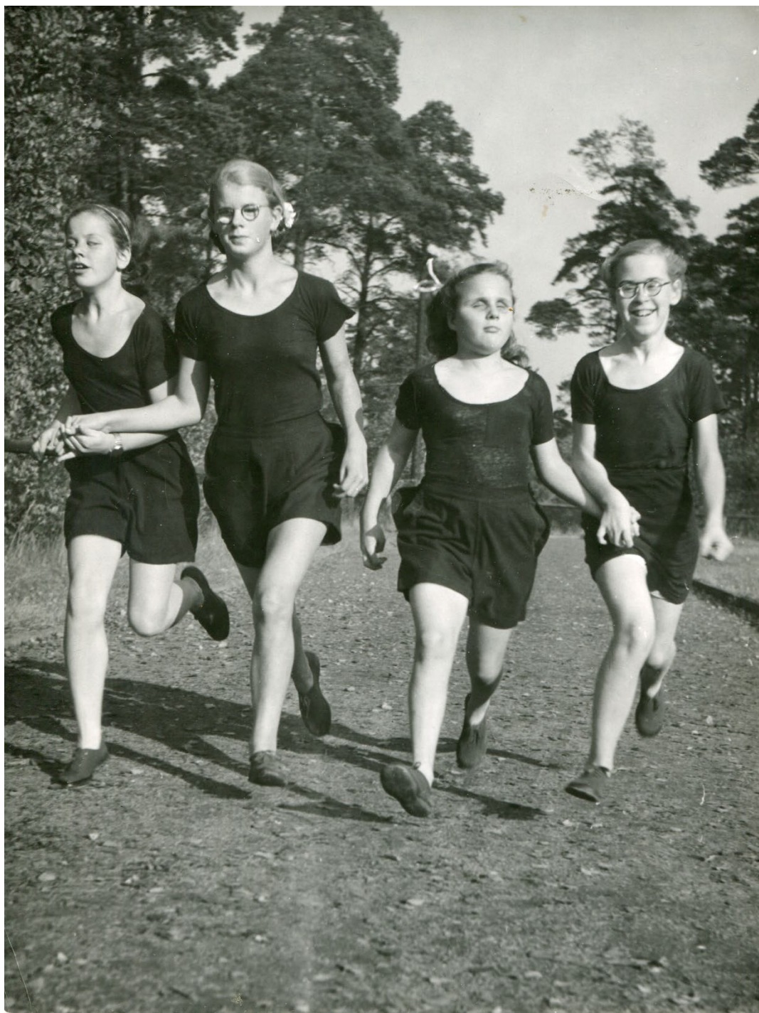
Fyra löpande flickor på Tomtebodavallen, som tävlar i 60-meter.