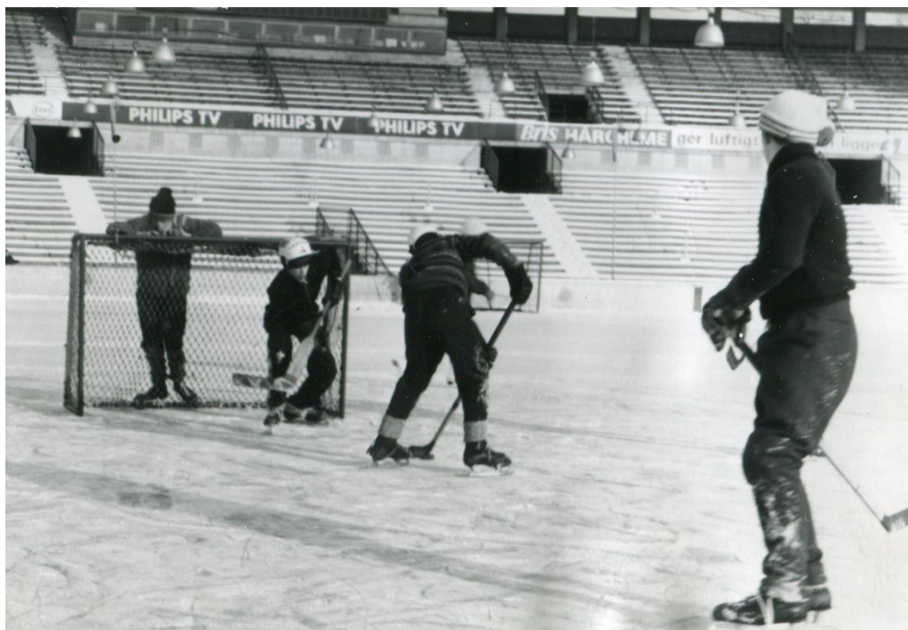
Bild visar Tomtebodaelever som spelar ishockey på Stockholms Stadion 1964