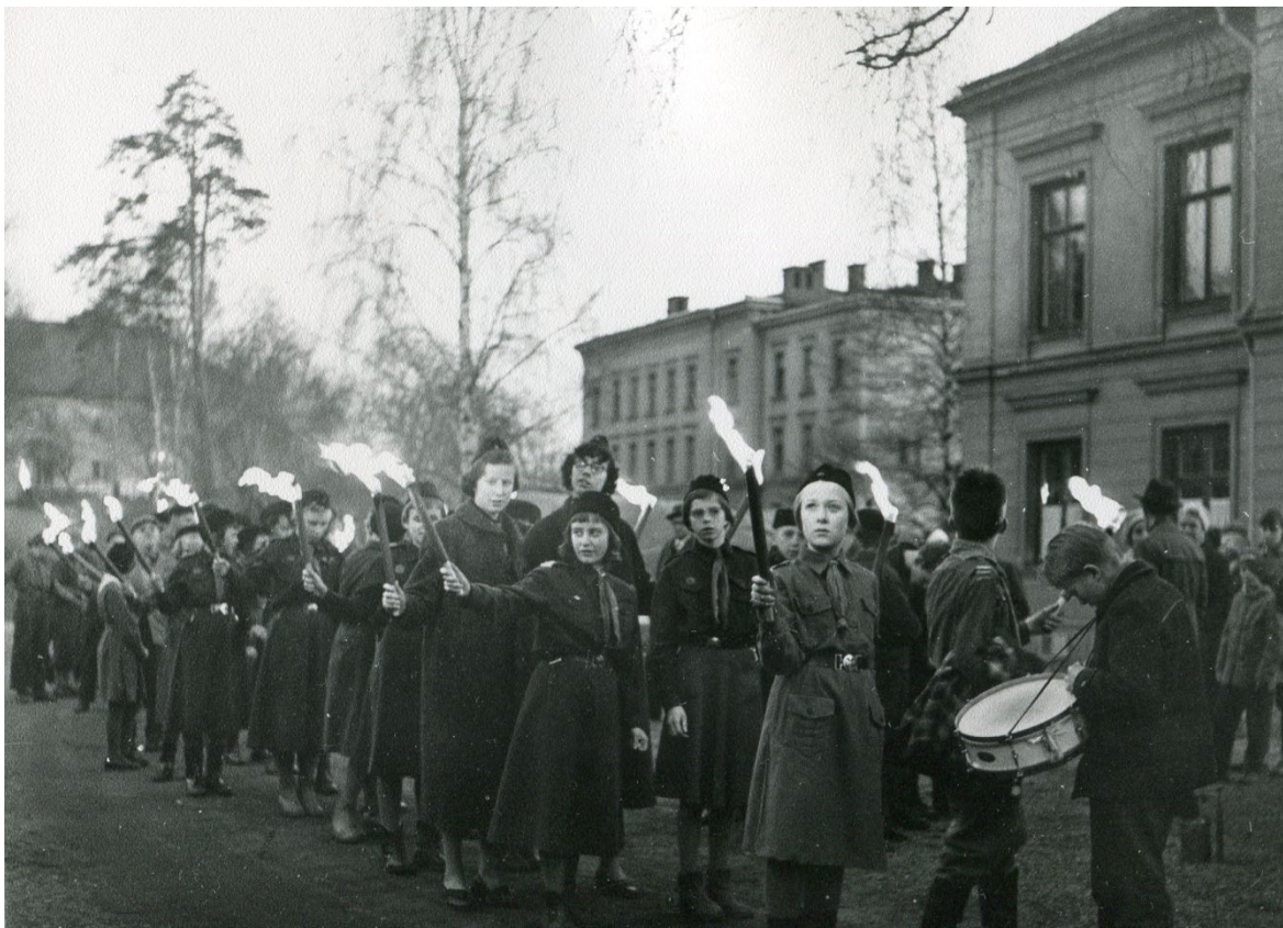
Bild på flickscouter som tågar med brinnande facklor i händerna över Tomtebodaoområdet år 1940.