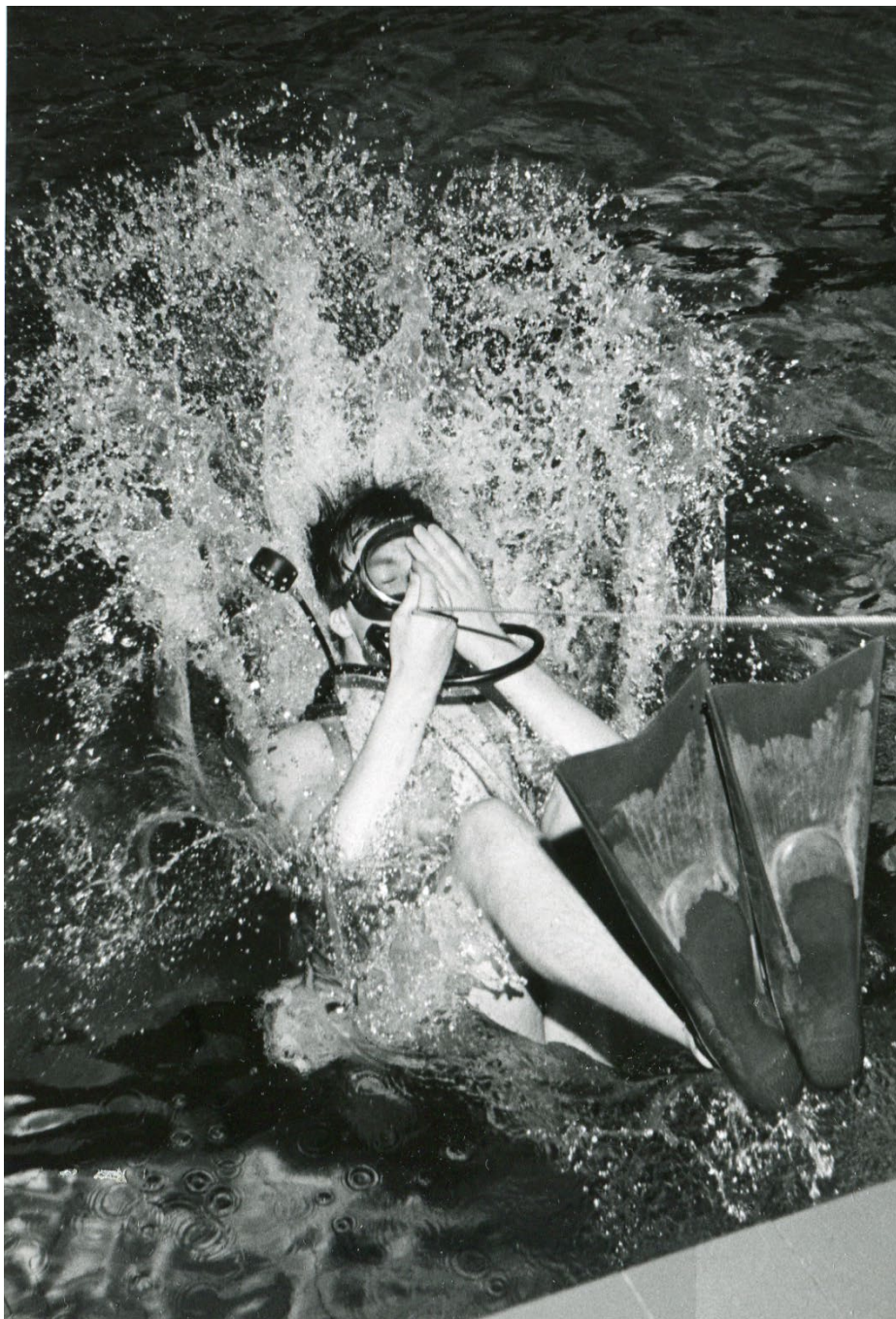
Bilden visar elev med dykutrustning som kastar sig baklänges ner i bassängen vid dykarkurs på Tomtebodå 1967.