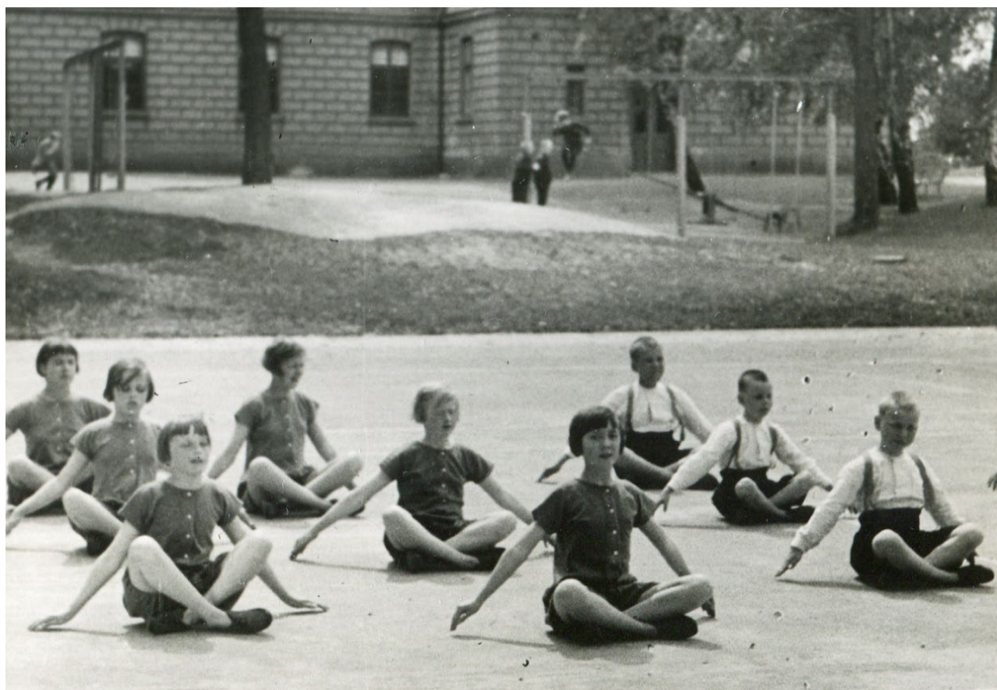
Bild på gymnastiserande elever utomhus framför Förskolan på Tomtebodas omkring år 1940.