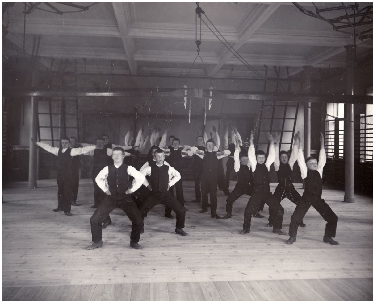
Bild som visar den nybyggda gymnastiksalen på Tomtebodas med gymnastiserande pojkar klädda i svarta byxor och väst samt vita skjortor. Foto taget cirka 1900.