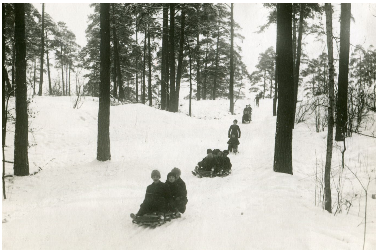
Bild som visar elever på kälkar och sparkstötting i den nyanlagda kälkbacken på Tomteboda, 1926.

Året därpå anlades en 200 meter lång kälkbacke på Tomtebodas, som användes flitigt snörika vintrar. De små barnen åkte på mindre träkälkar, medan de större åkte flera stycken samtidigt på en stor träbob med ledade medar fram till så att barnen kunde styra. Det var åtråvärt att uppnå den ålder då man fick åka med den stora bobben.