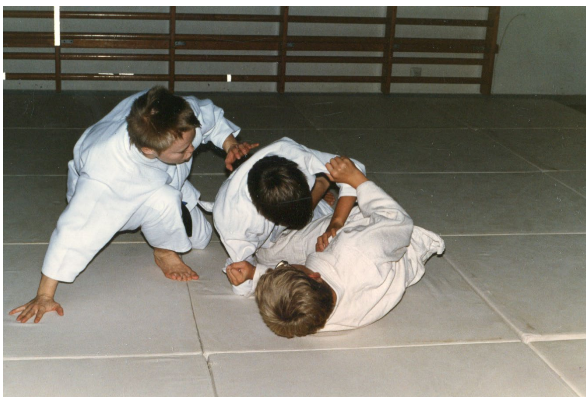
Bilden visar tre pojkar i judo-dräkter, som rullar runt på golvet, under träning vid kurs i judo på Tomtebodan 1980-tal.

Under 1999 gjorde SRF en undersökning där frågor ställdes till medlemmar i åldern 7-16 år samt deras föräldrar. Det framkom att många föräldrar kände en stark oro för att skolan inte ska klara av att ta sitt ansvar för de synskadade barnens skolgång, även om de flesta barnen trivdes i skolan. Hur det stod till med gymnastik idrott och fritid ingick inte i undersökningen. När man studerar tidningen Föräldrakontakten under 1990-talet så står det inte heller där något nämnvärt om detta. Istället kan man se hur tidningen mer börjat fokuserar på frågor kring barn med flerhandikapp, samt på långa reportage med synskadade ungdomar som förebilder.