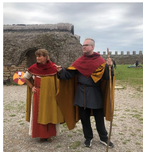
Eketorps borg med de två guiderna i tidsenlig klädsel.

Därefter styrde vi kosan till Mörbylånga för att äta lunch. Tillbaka till Allégården för vila, promenad eller ett dopp i poolen. Framåt kvällen åkte vi till Färjestaden och flanerade i hamnområdet och åt middag på hotell Skansen. Vi avslutade kvällen utomhus med prat och skratt.