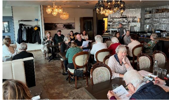
En del av deltagarna på höstmötet.