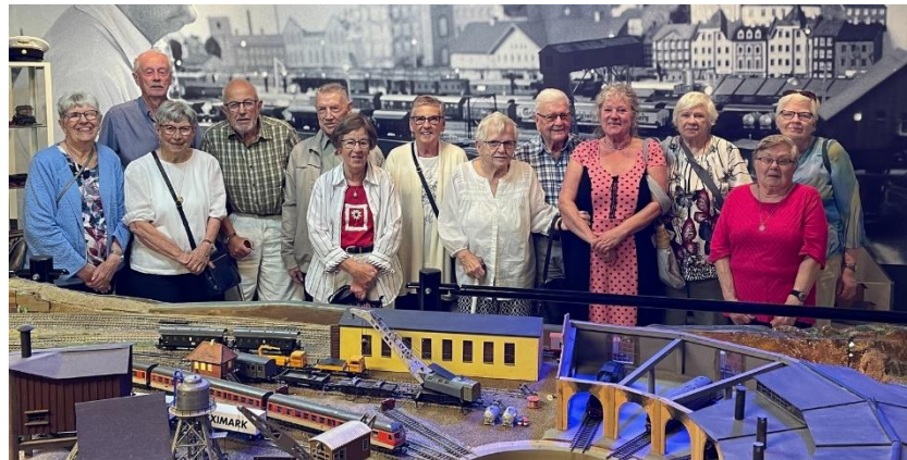
SRF Ljungby besöker minivärlden

Den 21 september var vi på besök på Minivärlden. Minivärlden i Ljungby har blivit känd både i Sverige och utomlands. Den har byggts upp av den ideella föreningen Ljungby