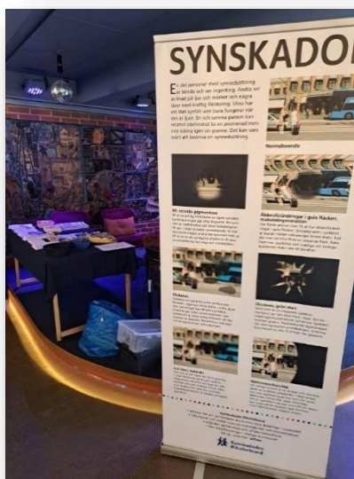
Information om olika synskador