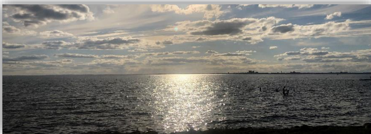
Ölandsresan 15 - 17 augusti 2023