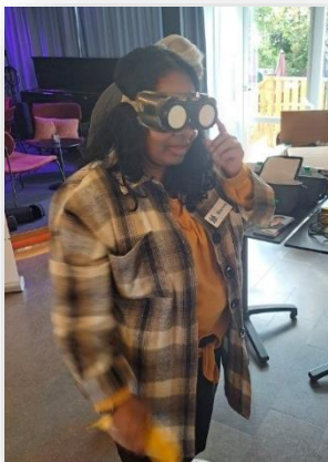
Test av glasögon med fingerad optik