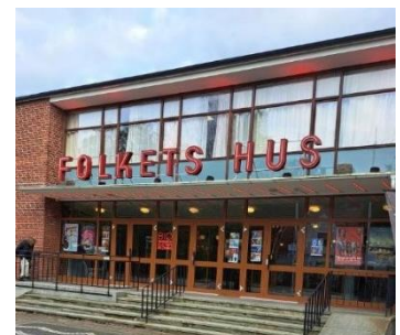
Älmhults Folkets Hus

Tisdagen den 10/10 2023 anordnades ögats dag i Älmhults Folkets Hus. Dagen började med en trevlig morgonfika med samtliga deltagare, vilka utgjordes av SRF-medlemmar från hela länet. Efter en stunds allmänt samtalande och givande gemenskap var det dags för dagens första föreläsning.